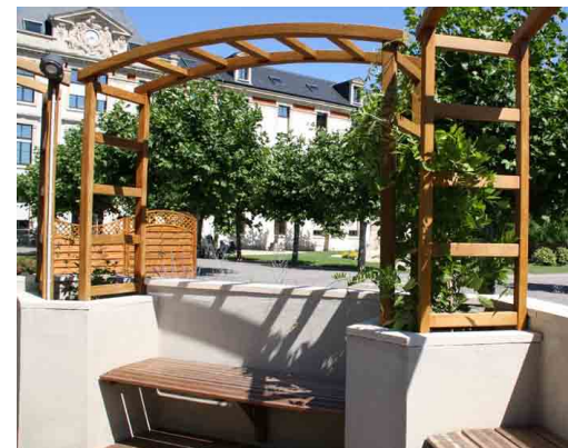
Le jardin « Art, Mémoire et Vie » du CHU de Nancy créé en 2007 a reçu le label Alzheimer / Grande Cause Nationale ainsi qu'une bourse Jardins et Santé. En 2010, il a ouvert au public lors des Journées européennes du Patrimoine.

Le jardin est un apport indéniable face aux troubles psycho-comportementaux présents chez plus d'un patient sur deux au fil de l'évolution. Errance, déambulation, mais aussi agitation, agressivité sont améliorés chez les patients qui peuvent y accéder en permanence. Le jardin, contribue aussi à favoriser les visites de l'entourage ; il se révèle propice à la mise en place d'activités inter ou transgénérationnelles. Le jardin apparaît adapté à la pratique de différentes thérapies non médicamenteuses : les ateliers individuels ou en petits groupes sont assurés par les différents professionnels de l'équipe. Chacun selon ses compétences et sa spécialisation, psychologue, neuropsychologue, orthophoniste, ergothérapeute, psychomotricien, y développe l'axe de la mémoire, de la communication, des praxies pour des prises en soins bénéfiques aux patients.