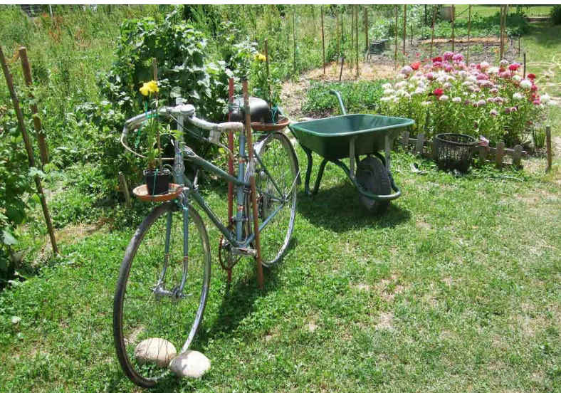
À Grenoble, le jardin du Centre de Santé mentale de la MGEN a reçu une bourse Jardins et Santé en 2009.