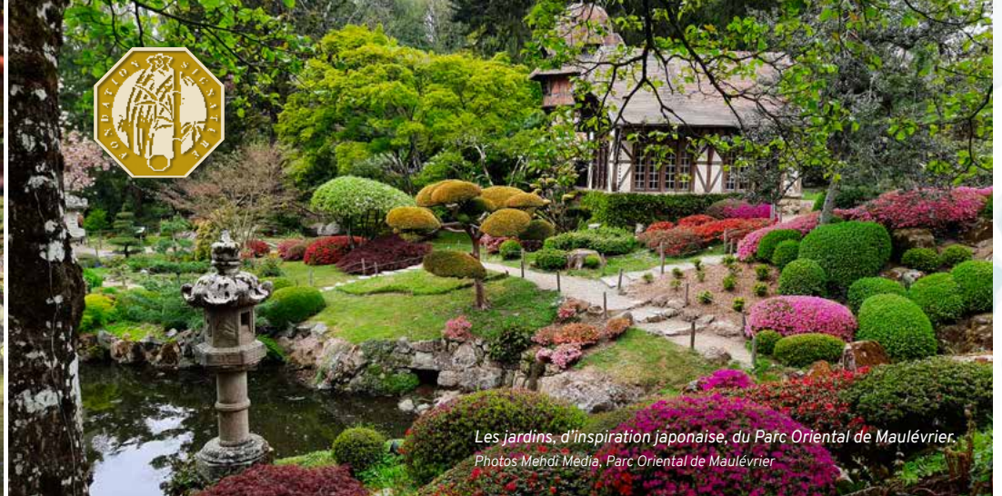
Les jardins, d'inspiration japonaise, du Parc Oriental de Maulévrier.